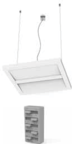
DIP Switch for VARIO LUMEN®